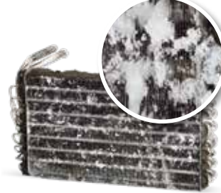
Klima bakımı olmadan