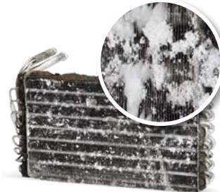
Pa mirëmbajtje të ajrit të kondicionuar