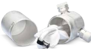
Me mirëmbajtje të ajrit të kondicionuar