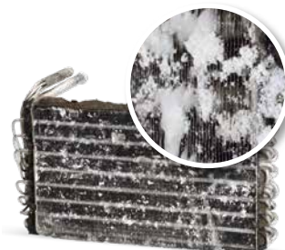
Brez vzdrževanja klimatske naprave