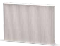
Cu întreținerea climatizării