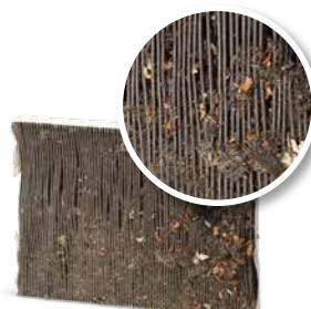
Sem manutenção do ar-condicionado