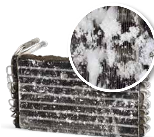
Без поддръжка на климатика