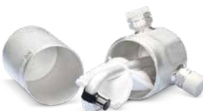
С поддръжка на климатика