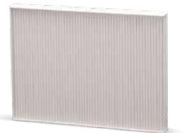
С поддръжка на климатика