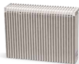
С поддръжка на климатика

Филтърът-дехидратор отстранява замърсяващи частици от хладилния агент и улавя влагата. Но улавящата способност на филтъра-дехидратор е ограничена, затова като превантивна мярка при по-стари превозни средства и/или дълъг пробег е препоръчителна смяна с цел защита на климатика от повреда поради влага в системата.