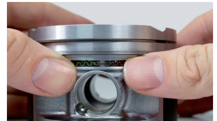
Resim 3: Lamellerin her iki renkli işaretlemesi de görünür olmalıdır.