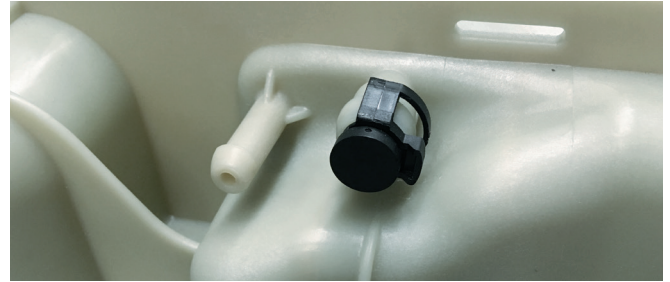
Resim 3: EURO 4 ve 5 araçlarda bağlantı yuvası bir kör tapa ile kapatılmalıdır