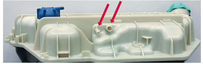
Resim 2: İki bağlantı yuvalı yeni nesil genleşme haznesi