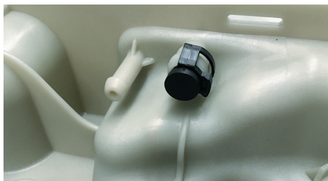
Figura 3: En EURO 4 y 5, la conexión se deberá cerrar con un tapón roscado