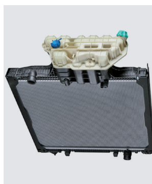
Figure 1 : Radiateur de refroidissement MAN avec vase d'expansion.

Sur ces modèles de radiateurs de refroidissement, le radiateur et le vase d'expansion forment un seul bloc. Si le vase d'expansion est trop plein, l'excès de liquide de refroidissement s'échappe par la soupape d'expansion du couvercle de fermeture bleu lorsque la température du moteur ou la pression du système augmentent. Le liquide de refroidissement qui s'est échappé par le haut ou a coulé à côté de l'orifice de remplissage pendant le remplissage s'écoule vers le bas par des canaux d'écoulement et ressort entre le radiateur et le vase d'expansion, ce qui peut être interprété à tort comme une fuite.