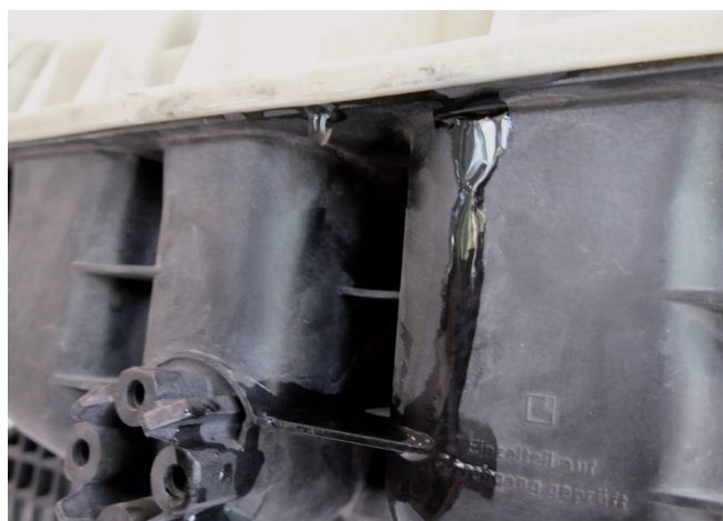
Figure 3 : L'excès de liquide de refroidissement ressort dans la zone du joint de séparation au niveau du vase d'expansion.