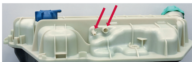
Figura 2: Depósito de expansión de la nueva generación con dos conexiones