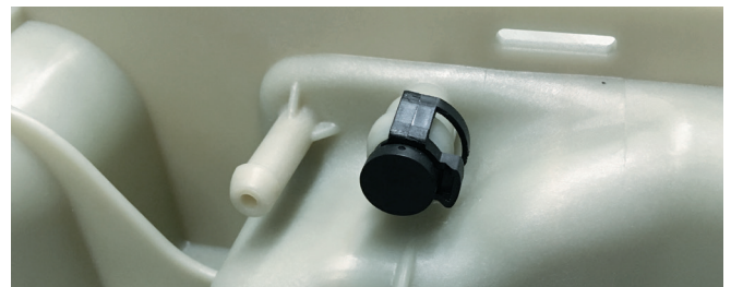
Abbildung 3: Bei EURO 4 und 5 muss der Anschluss mit einem Blindstopfen verschlossen werden