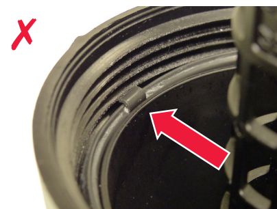
Rys. 4. Uchwyt zakleszczony w gwincie

WAŻNE! Przed montażem należy zawsze posmarować nowe uszczelki czystym olejem, aby uniknąć uszkodzeń i wycieków. Oprócz tego zbyt wysoki moment dokręcania może spowodować wyciek oleju, dlatego należy koniecznie przestrzegać instrukcji producenta!