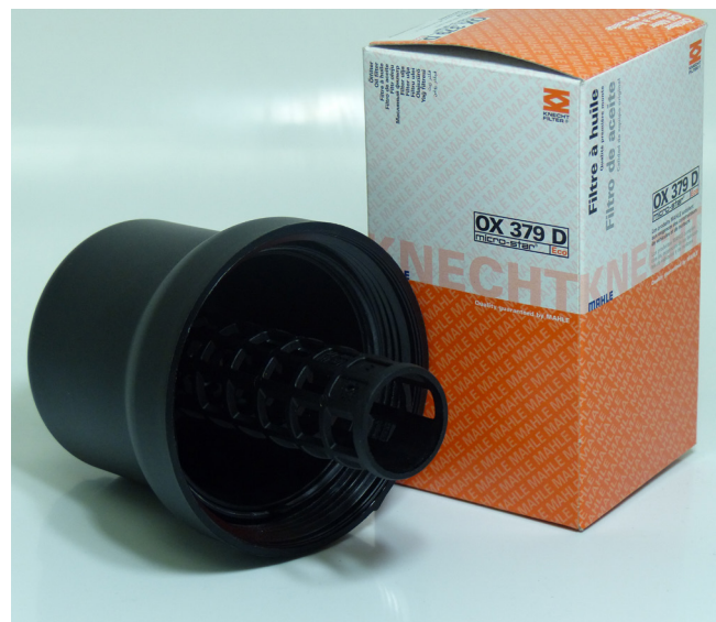
Rys. 1. Wkład filtra oleju ze zdemontowaną pokrywą obudowy

W przypadku uszczelek dla powyższych wkładów filtrów oleju należy także pamiętać, że zintegrowany uchwyt powinien być skierowany do góry i widoczny w pokrywie (patrz rys. 3). Jeśli uszczelka zostanie nieprawidłowo zamontowana lub uchwyt przypadkowo zahaczy się na gwincie (patrz rys. 4), nastąpi wyciek oleju w pokrywie filtra.