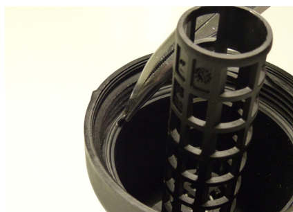
Rys. 2. Uchwyt pomaga zdemontować starą uszczelkę