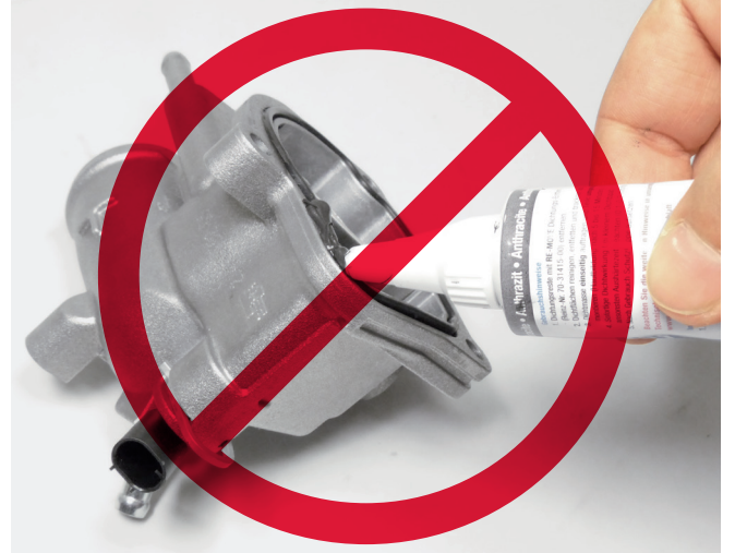
Resim 3: Ek sızdırmazlık maddeleri contalara hasar verebilir ve işlevlerini sınırlayabilir.

Bu termostat tipi için karakteristik olan, termostat muhafazasındaki elektrik bağlantısıdır. Bu bağlantı, yanlışlıkla bir sıcaklık sensörü için olduğu varsayılır ve örn. kontrol etmek amacıyla sökülecek olursa, ısıtma elemanının pinlerinde ve kablolarında hasarlar meydana gelebilir. Bunun sonucunda termostatın fonksiyonu artık sağlanamaz; bu da termik problemlere ve motor kontrol ünitesine ilgili arıza belleği kayıtlarının yapılmasına yol açar.