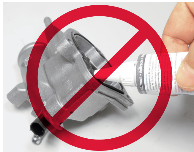
Figura 3: Los sellantes adicionales pueden dañar las juntas y limitar el funcionamiento.

¡IMPORTANTE! ¡No se deben soltar ni desmontar los clips de retención de los conectores! ¡Al montar termostatos, en general no está permitido emplear sellantes adicionales, y se deben utilizar exclusivamente las juntas sólidas originales!