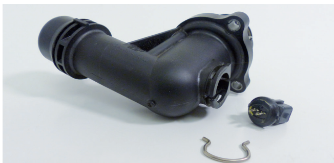
Figura 1: Termostato electrónico con el clip de retención suelto y la conexión rota

Lo característico de este diseño es la conexión eléctrica en la carcasa del termostato. Si dicha conexión se utiliza erróneamente para un sensor de temperatura y p. ej. se desmonta para su revisión, esto puede causar daños en los pines y los cables del elemento calefactor. Como consecuencia, el termostato deja de funcionar, lo que a su vez provoca problemas térmicos y los consecuentes registros en la memoria de errores de la unidad de mando.