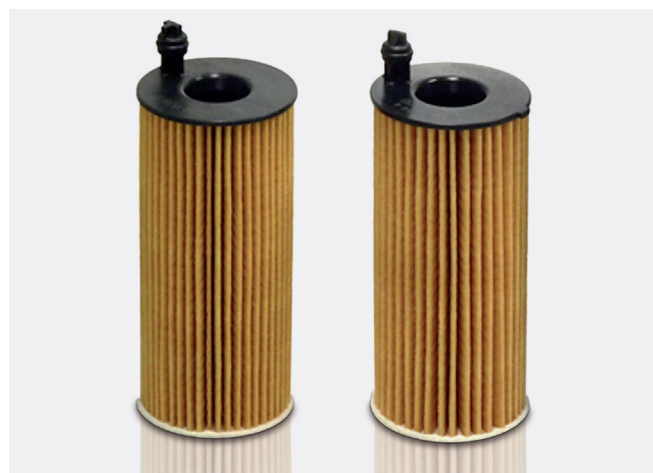
Ilustracja 1: Prawie identyczne z wyglądu wkłady filtrów oleju: po lewej stronie OX404 i po prawej stronie OX813/1

WAŻNE! Przed montażem bezwzględnie sprawdzić przygotowanie prawidłowego wkładu filtra oleju i ewentualnie upewnić się, że w jego wnętrzu widoczny jest nosek prowadzący (patrz ilustracja 2).