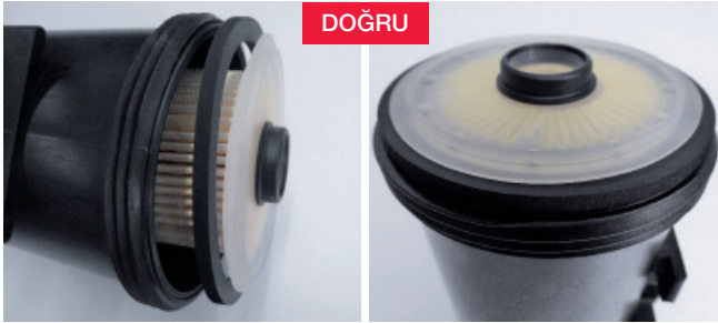
Şekil2: Doğru dizilim