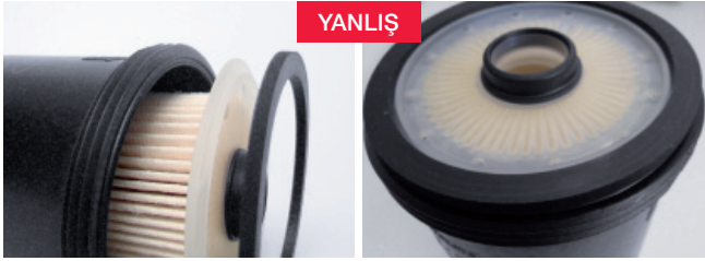
Şekil1: yanlış dizilim

İpucu: Her filtre deęişiminde, sızdırmazlık o-ringinin gövde kapağı üzerine doęru oturtulduğundan emin olunuz!