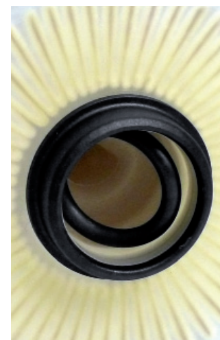
Ilustracja 4: Uszczelka została osadzona we filtrze