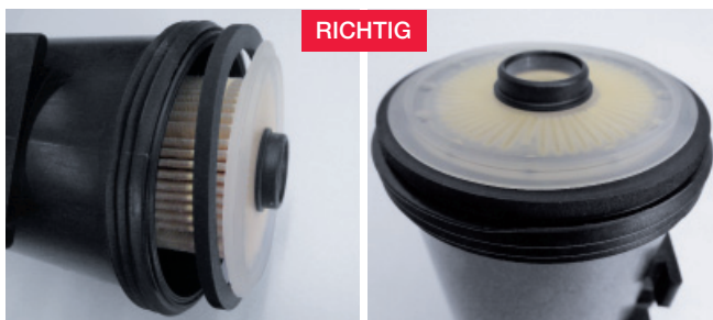
Abbildung 2: Richtige Reihenfolge