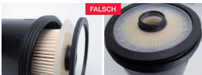
Abbildung 1: Falsche Reihenfolge

Daher unser Tipp: Bei jedem Filterwechsel den Sitz des Dichtrings prüfen!