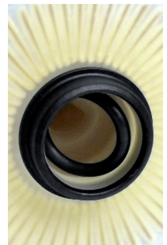
Abbildung 4: Dichtung im Filter stecken geblieben