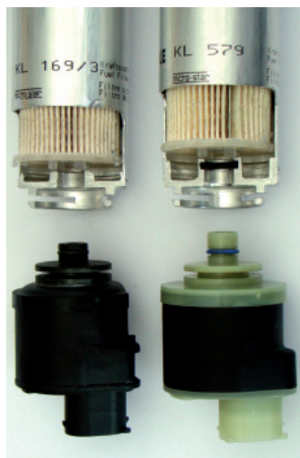
Bild 2: Der passende Heizer für den jeweiligen Kraftstoffleitungsfilter