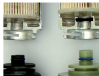
Bild 3: Deutliche Unterschiede in der Heizerschnittstelle (kurzes und langes Stück)