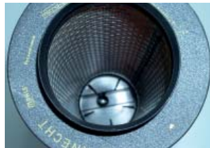
Bild 2: Filterinnenansicht mit Deckel – mit montiertem Gehäusedeckel ist der Filter von MAHLE, ebenso einseitig verschlossen wie der Originalfilter.