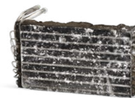
Sans maintenance du système de climatisation