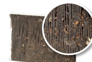
Sans maintenance du système de climatisation