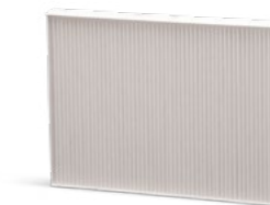
Avec maintenance du système de climatisation