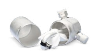
Avec maintenance du système de climatisation