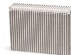
Avec maintenance du système de climatisation