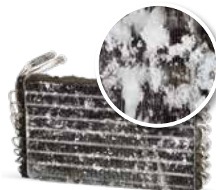
Sans entretien de la clim