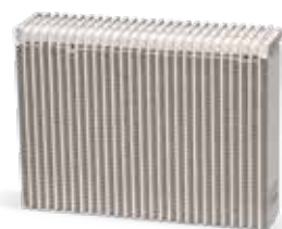
Avec entretien de la clim

Dans les véhicules électriques et hybrides , une climatisation régulièrement entretenue et en bon état de fonctionnement joue également un grand rôle dans le refroidissement de la batterie de propulsion sensible à la température et a un impact positif sur sa longévité et sur l'autonomie du véhicule.