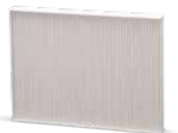
Avec entretien de la clim