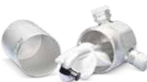
Avec entretien de la clim