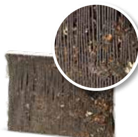
Sans entretien de la clim