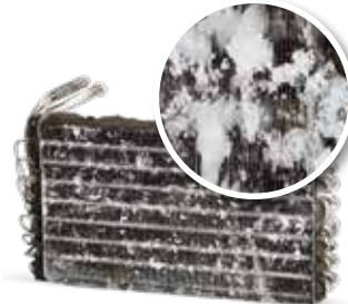
Sin mantenimiento de la climatización