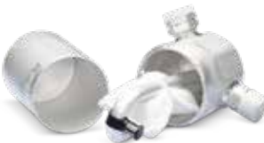
Con mantenimiento de la climatización