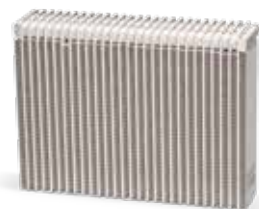
С поддръжка на климатика

Редовно поддържаната, добре функционираща климатична система играе важна роля за охлаждането на чувствителната към температурата тягова акумулаторна батерия също при електрическите и хибридните превозни средства и има положителен ефект върху нейната трайност и пробега на превозното средство.