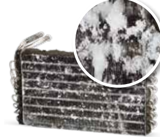
Klima bakımı olmadan