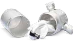
Klima bakımı ile