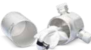
Avec entretien de la clim

La bouteille déshydratante élimine les impuretés du fluide frigorigène et retient l'humidité contenue dans le circuit. Mais sa capacité est limitée, d'où la nécessité de la remplacer régulièrement pour assurer le bon fonctionnement de la climatisation.