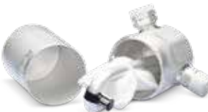
Con mantenimiento de la climatización