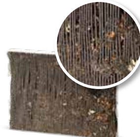
Sin mantenimiento de la climatización