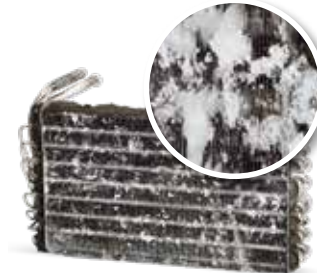
Sin mantenimiento de la climatización