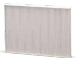
С поддръжка на климатика