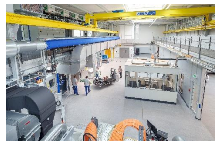
MAHLE Powertrain opera un moderno centro de desarrollo de tecnologías de baterías en Stuttgart.