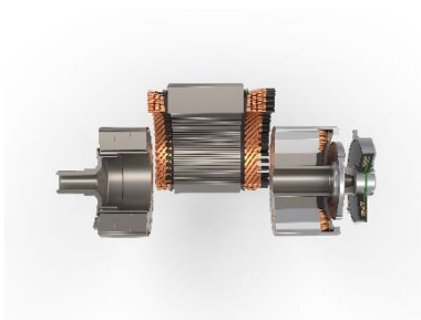
Con el nuevo kit tecnológico para motores eléctricos, MAHLE combina las ventajas de sus productos SCT y MCT por primera vez.