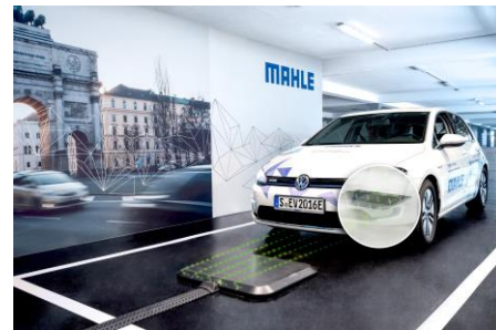
El sistema de carga inalámbrica de vehículos eléctricos de MAHLE se ha convertido en el estándar global.