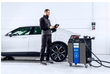
La solución de diagnóstico de baterías para vehículos eléctricos: E-HEALTH Charge combina carga y diagnóstico y proporciona información fiable sobre la "salud" de la batería de alto voltaje.