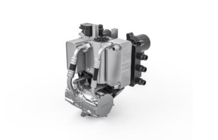
El módulo de gestión térmica de MAHLE consigue incrementar en un 20% la velocidad de cruce del vehículo reduce el espacio de instalación y disminuye costes.