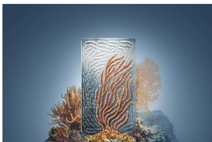
Tomando a la naturaleza como ejemplo: Con esta nueva placa biónica de refrigeración de baterías, MAHLE ha conseguido un salto tecnológico.